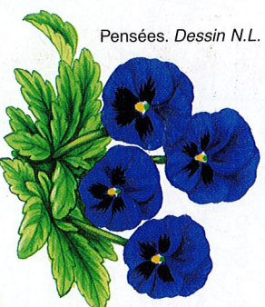
Pensées. Dessin N.L.