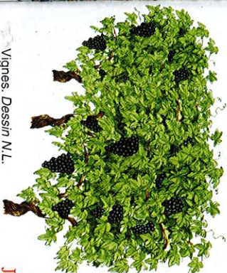
Vignes. Dessin N.L.

« La Carcassonne citée des machines cathédrale cloître église Saint-Jacques de l'Armagnac, datant de 1850